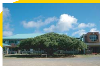
日本の景観を誇るガジュマル