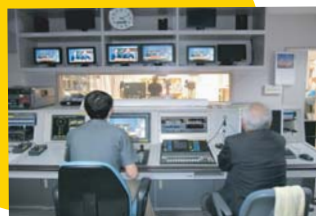
地元ケーブルテレビ見学